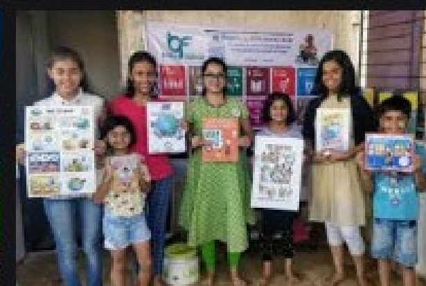
SDG Book Club | United Nations un.org