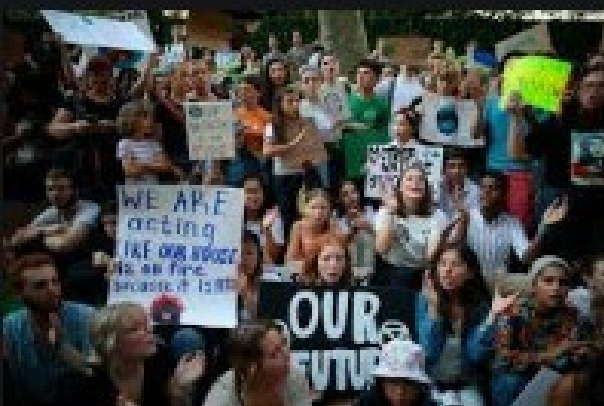
Sustainable Development Takes ... worldpoliticsreview.com