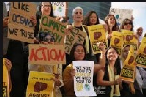
IISD/ENB @ HLPF 2019 | 12 July ... enb.iisd.org