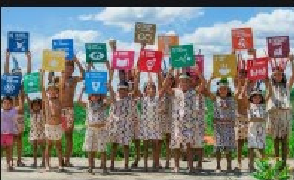
Sustainable Development Goals ... undp.org