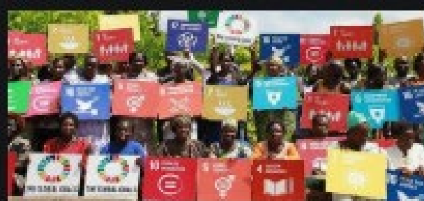
Sustainable Development Goals ... sdgactioncampaign.org