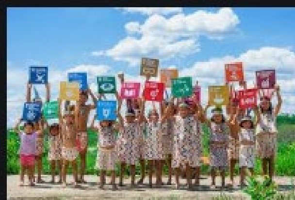
Rapport mondial sur le développ... un.org