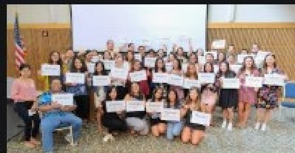
E Kamakani Hou | Donors help p... westoahu.hawaii.edu