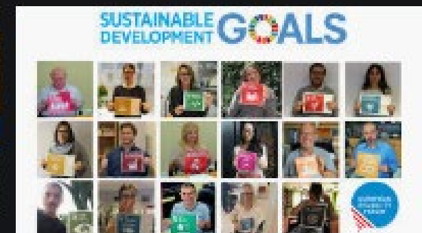
People in Europe and around the... edf-feph.org